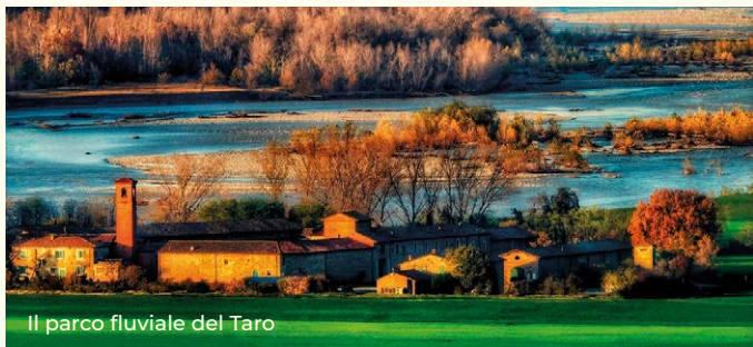
Il parco fluviale del Taro

Collecchio, l'antico Colliculum (piccolo colle), è disteso tra dolci pendii e la pianura fluviale, tra il Parco Naturale dei Boschi di Carrega e il Parco Fluviale del Taro , area protetta, rotta di migrazione e sito di nidificazione di diverse specie di uccelli. Lì sorge la Corte medievale di Giarola , punto di partenza per escursioni e tappa della Via Francigena.