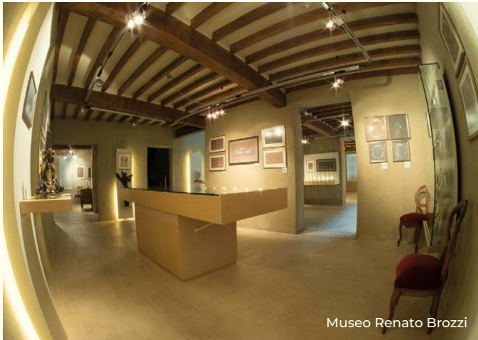
Museo Renato Brozzi

La sua particolare posizione ai piedi dell'Appennino e il microclima dato dal fiume hanno creato un' oasi naturale , l' Oasi di Cronovilla , oggi attrazione per fotografi e appassionati di birdwatching.