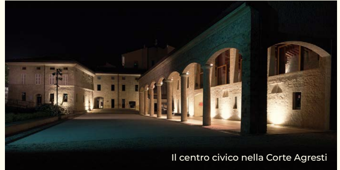
Il centro civico nella Corte Agresti

All'interno del centro civico La Corte si nasconde il piccolo museo dedicato a Renato Brozzi , scultore, incisore e orafo traversetolese.