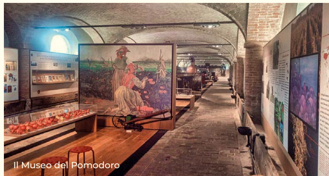
Il Museo del Pomodoro

testimoniano la storia comune di uomini e donne “dell'età del pane”, quando il lavoro nei campi sostanzava di sé il profondo legame dell'uomo con la vita.