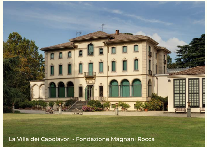
La Villa dei Capolavori - Fondazione Magnani Rocca

Oltre alle sue opere si possono leggere le lettere scritte al grande amico Gabriele D'Annunzio .