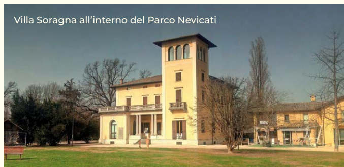
Villa Soragna all'interno del Parco Nevicati

“L'oro rosso” americano, diventato un simbolo della cucina italiana come “compagno immancabile” di un piatto di pasta trova, all'interno della Corte di Giarola , una interessante espressione nel Museo del Pomodoro affiancato dal Museo della Pasta .