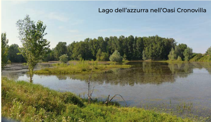
Lago dell'azzurra nell'Oasi Cronovilla

Situato sulla sponda sinistra del fiume Enza, Traversetolo è il comune più a est delle Valli di Parma.