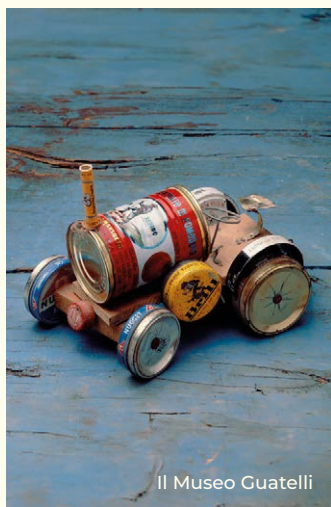
Il Museo Guatelli

“Io vorrei un museo dall'estremo ieri all'estremo oggi”